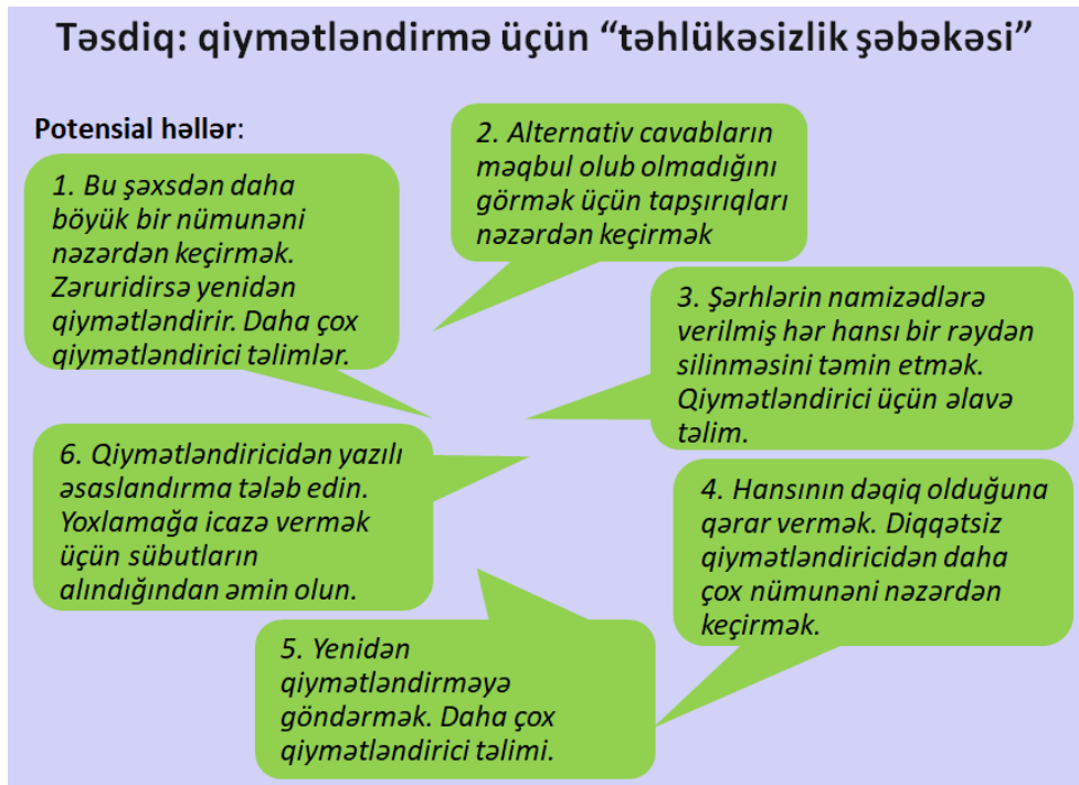
Şəkil 1.9. Həll üçün bəzi təkliflər